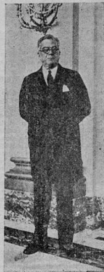
General don Gerardo Machado, Presidente de la República de Cuba, quien hoy celebra el aniversario de su independencia.