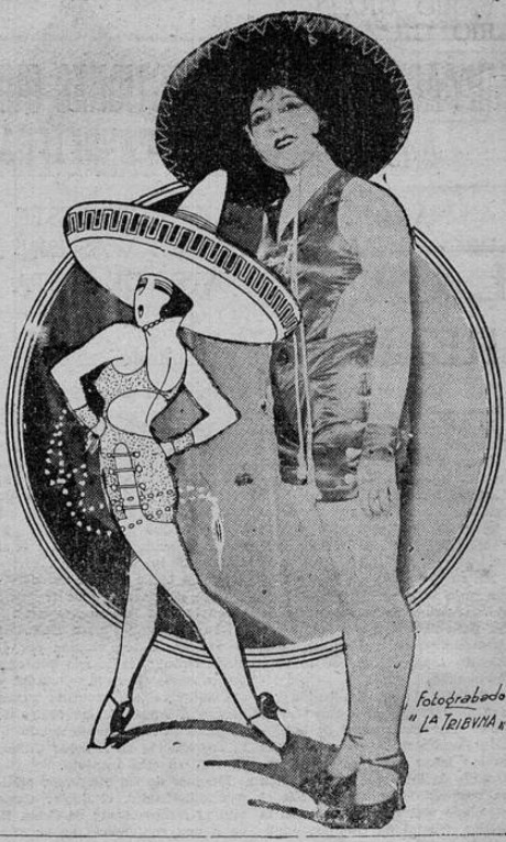
Fotografiado en LA TRIBUNA