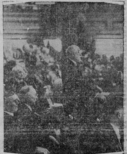
Con grandes ceremonias acaba de ser celebrado el centenario de la Iglesia de Jesucristo, fundada por los morrones en el año 1830 en la Ciudad del Lago Salado, Utah. La foto muestra un aspecto de tal celebración, a la cual asistieron más de diez mil personas