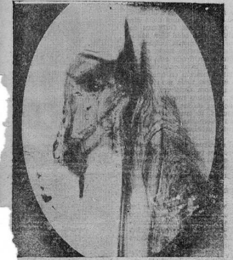
curiosa fotografía de un caballo se produjo por el descolocamiento de una tabla, de los nudos de la madera, mediante la acción natural de los rayos del sol. Tan curioso suceso ocurrió en un taller de carpintería de Madison, Wisconsin, en donde se preparaban muestras de madera para un laboratorio forestal