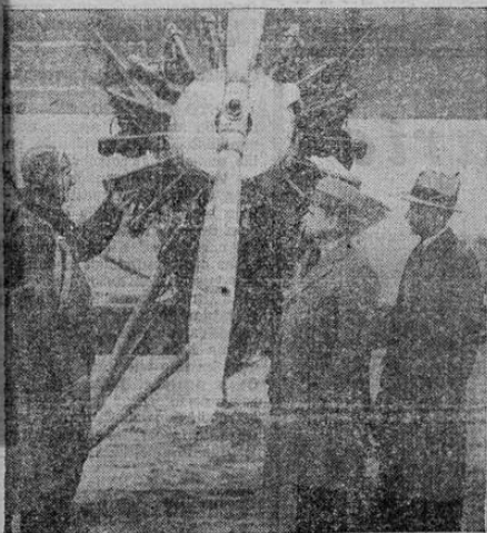
Ingenieros de Hartford, Conn., examinando un avión cuyo motor carece de carburador, estando en cambio equipado con su aparato que permite el uso de petróleo corriente en vez de gasolina como combustible