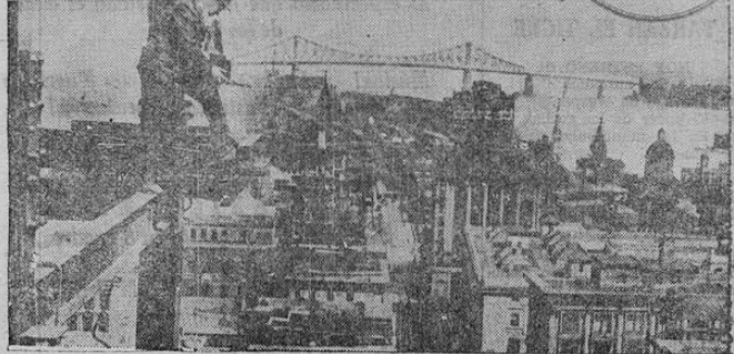
Este atrevido fotógrafo no vacila en arriesgar su vida subiendo a un rascacielos en construcción para poder retratar debidamente el nuevo puente de Montreal, cuyo valor es de doce millones de dólares, y ya próximo a ser concluido